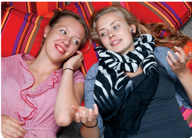
Bei uns darf jeder sein, wie er ist.

Die Malteser Hospizdienste bieten trauernden Menschen einen geschützten Rahmen, in dem sie mit ihrer Trauer jederzeit willkommen sind. Es gibt Raum für Tränen, Verzweiflung, Zorn, aber auch für viele schöne Erinnerungen und Gefühle. Darüber hinaus blicken wir mit Ihnen auf Ihre Erfahrungen und begleiten Sie dabei, Ihre eigenen Kräfte wiederzuentdecken.